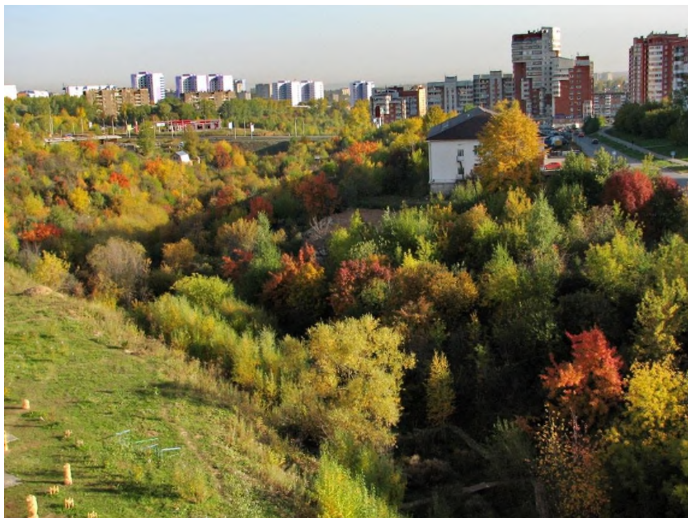
Долина реки Уинки

Долина Уинки меньше подвержена антропогенному воздействию, имеет густую прибрежную растительность, включая краснокнижные виды. Обитает более 40 видов лесных птиц, в том числе соловьи.