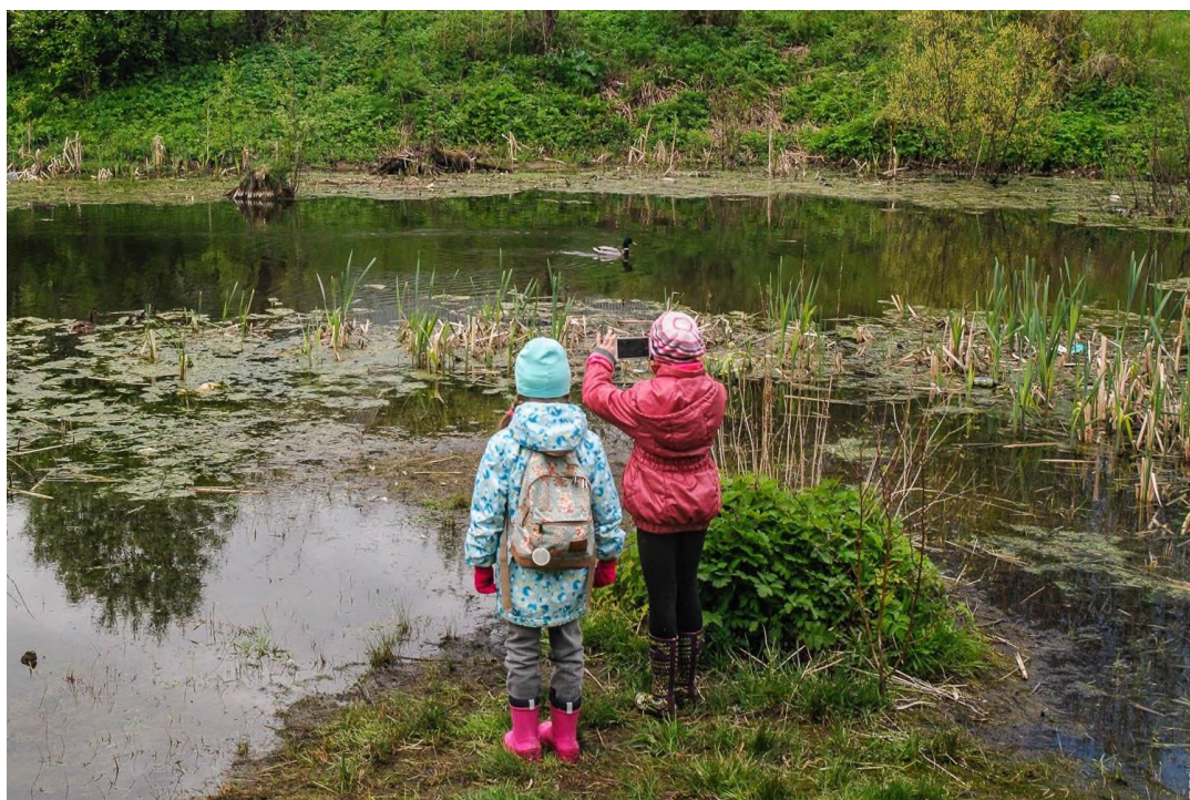
На Чёрном озере живет целое утиное семейство.

У истока одного из притоков Ивы можно встретить множество свидетельств интенсивной добычи меди 18 века. Далее тропа идет к р. Большая Ива, где прямо в русле можно было найти неплохие образцы медистых песчаников с зелёным малахитом и синим азуриком, а также с отпечатками древних растений пермского периода.