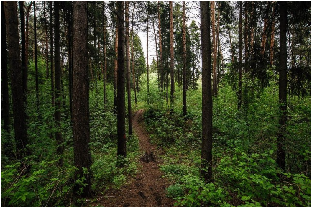
Отвалы Александровского медного рудника