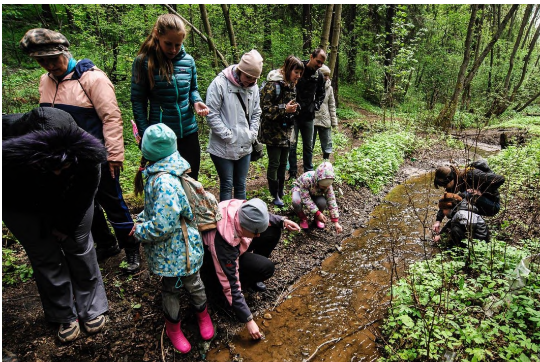
Поиск песчаников с малахитом и азури́том

Ещё одна точка с красивыми образцовыми медистых песчаников находится неподалёку в стенке старинного шурфа.