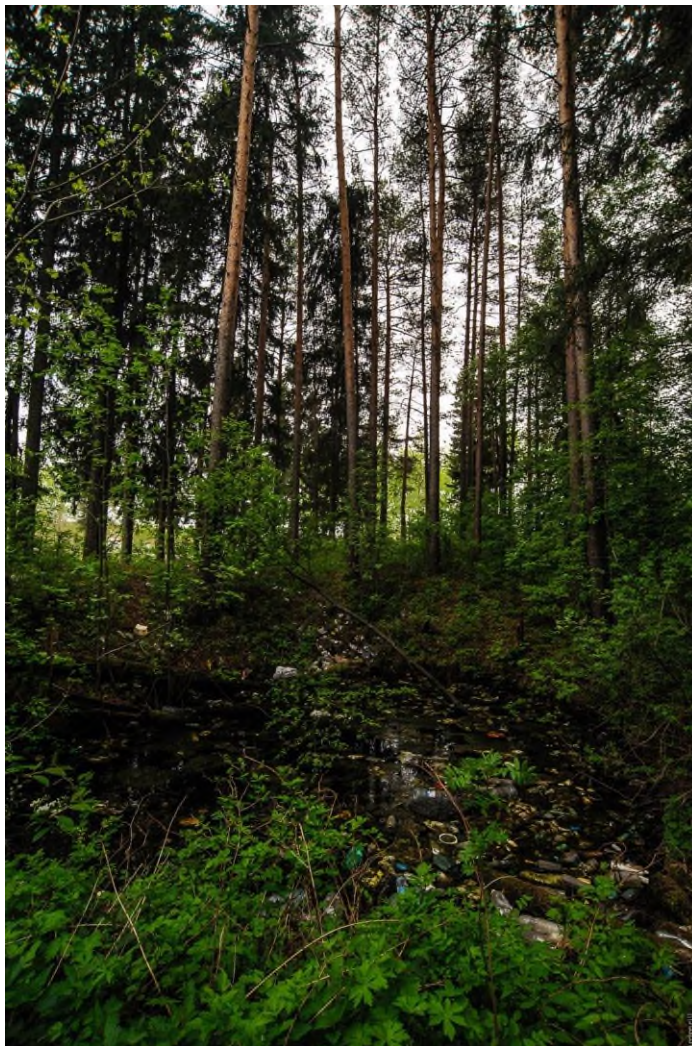
Затопленная шахта Александровского рудника